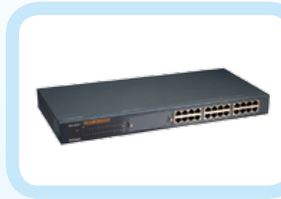
HUB & SWITCH