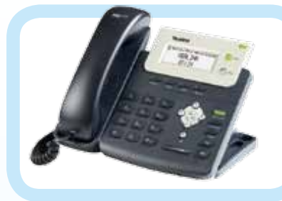
高畫質 IP Phone